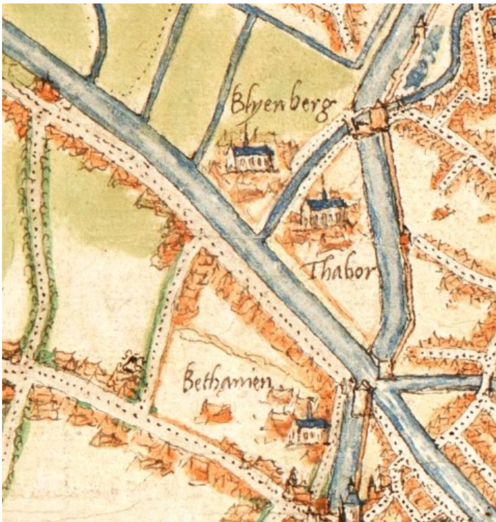
Kloosters van Thabor, Blijdenberg en Bethaniën op het plan van Jacob van Deventer