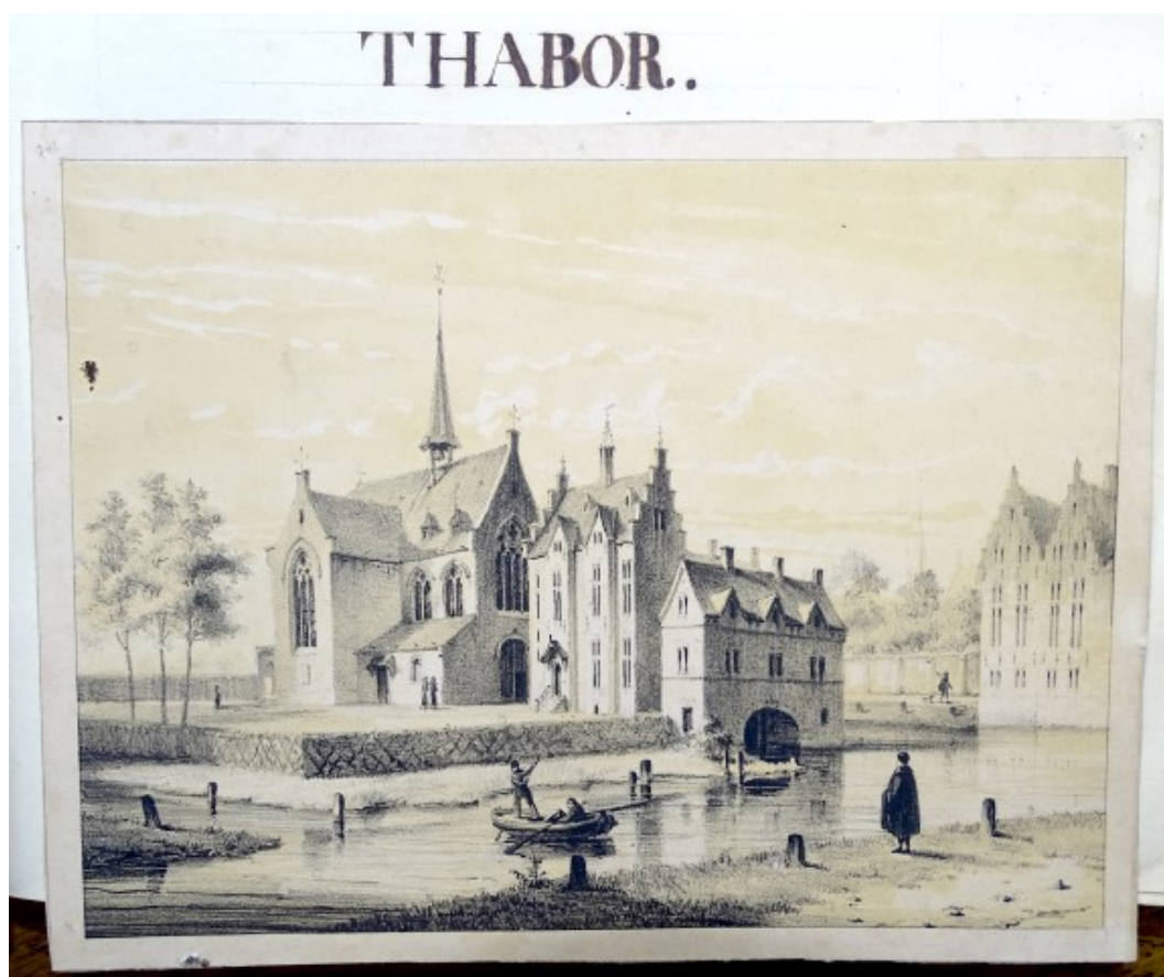
Klooster van Thabor in kroniek Thijs afschrift Van den Eynde (© Hugo Verstrepén)

lijk de tekening van Jan-Baptist de Noter (1786–1855) als voorbeeld gebruikt heeft 9 . Een sterk gelijkende tekening door Van den Eynde, maar dan zonder figuurtjes, staat ook weer afgebeeld in het boek van M. Kocken 10 .